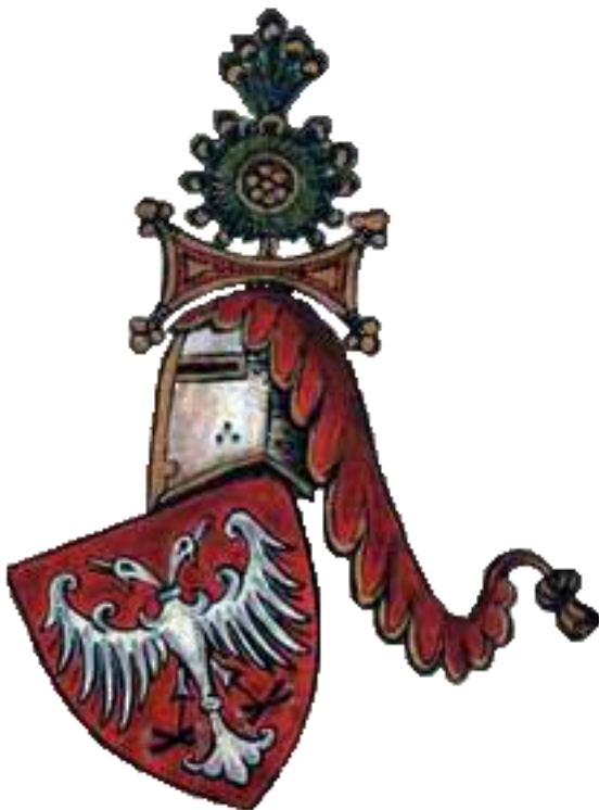
Грб Немањића из Фојничког грбовника (17.в.)