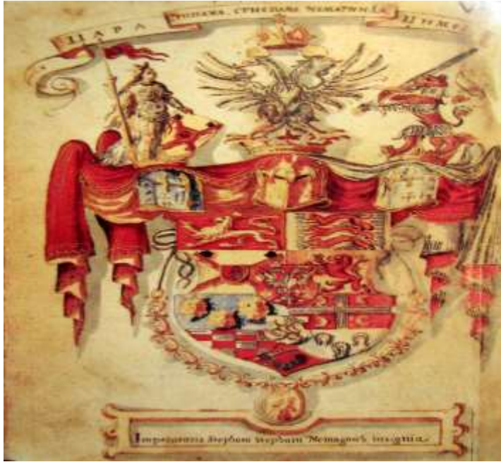
Грб цара Душана према грбовнику Корјенић - Неорић (16.в.)