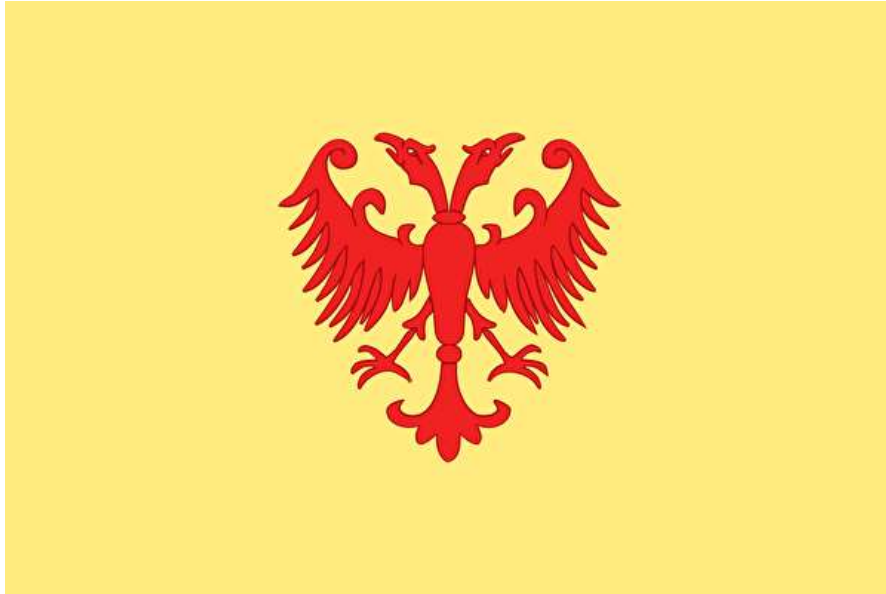
Најстарија позната српска застава (доба владавине краља Владислава, 13.в.)